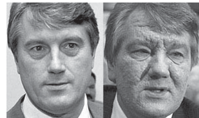
*Miembro del Consejo de Redacción

En el mes final de 2004, Rusia y el Occidente se enfrentaron en una pugna geopolítica por la influencia sobre Ucrania con motivo de las elecciones presidenciales de ese país, cuya parte occidental tiende hacia la OTAN y la UE, mientras su mitad oriental es prorrusa. Luego de una primera ronda electoral amañada, la presión occidental logró la celebración de otra, en la que, ante un ejército de observadores internacionales, triunfó el señor Yúschenko, liberal occidentalista, sobre el señor Yanukóvich, burócrata amigo de Rusia. Desde un punto de vista favorable a la libertad democrática, nos puede complacer ese resultado comicial, aunque como partidarios de un orden internacional multipolar nos conviene desear que se mantenga un equilibrio entre las esferas de influencia occidental y rusa.