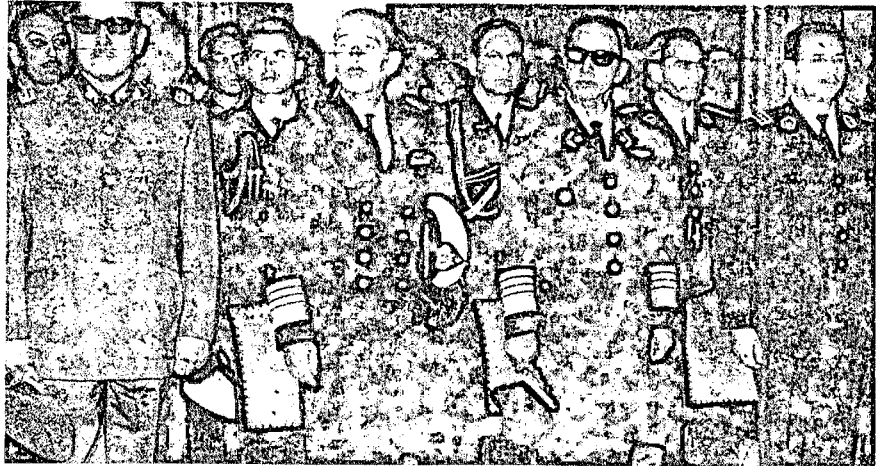
Los conspiradores en el poder.

Es importante que, con la colaboración de las grandes potencias, se logre un arreglo temporal sobre las bases señaladas. Quedaría entonces, a largo plazo, el problema de la solución histórica definitiva para la región palestina. El retorno por lo menos de parte de los refugiados árabes de Palestina a sus hogares originales y la indemnización a los demás, es una exigencia justa. En última instancia, después de unos decenios de distensión y de acercamiento gradual, una Conferencia Israelo-Arabe podría ser la solución al problema palestino.